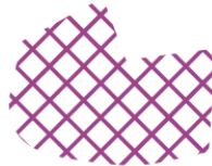
Area proibita al transito, non segnalata

Aree proibite – i vari percorsi sono caratterizzati dalla presenza di diverse aree protette (principalmente paludi e torbiere) le quali sono indicate sulla cartina come aree proibite al transito, non percorribili e non attraversabili, pena la squalifica. In alcuni casi le zone sono segnalate sul terreno da nastri delimitanti parzialmente o completamente il perimetro, anch'essi riportati in cartina, come da esempi seguenti: