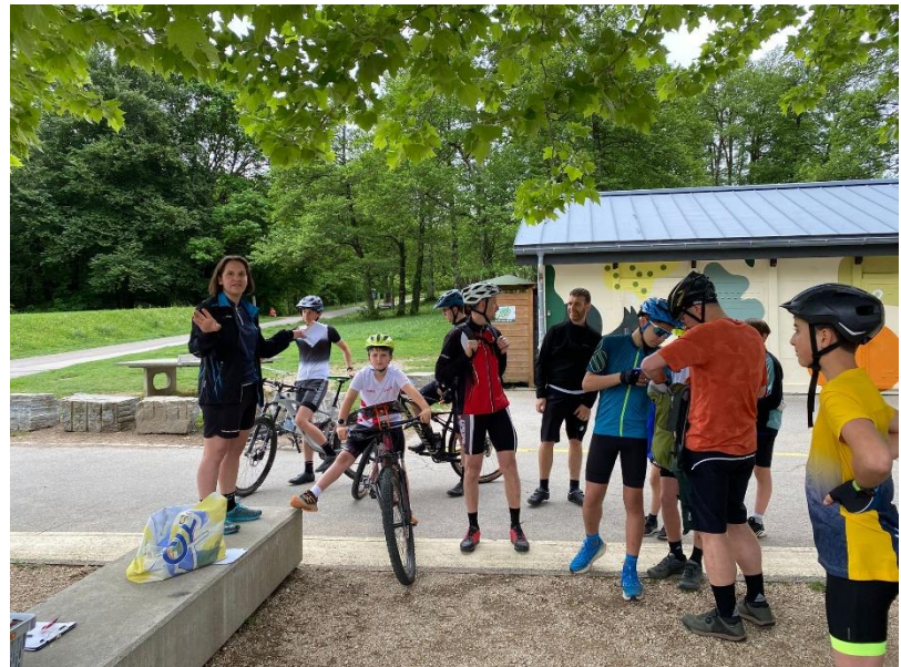
Le istruzioni per i neofiti

Alla mattinata, ancora fresca, si sono presentati in 36 partenti, che hanno apprezzato la proposta e hanno pedalato in lungo e in largo nel bosco, su strade sterrate, sentierini puliti e ben praticabili, altri con radici affioranti, che hanno richiesto a volte di prendere la bici in spalla.