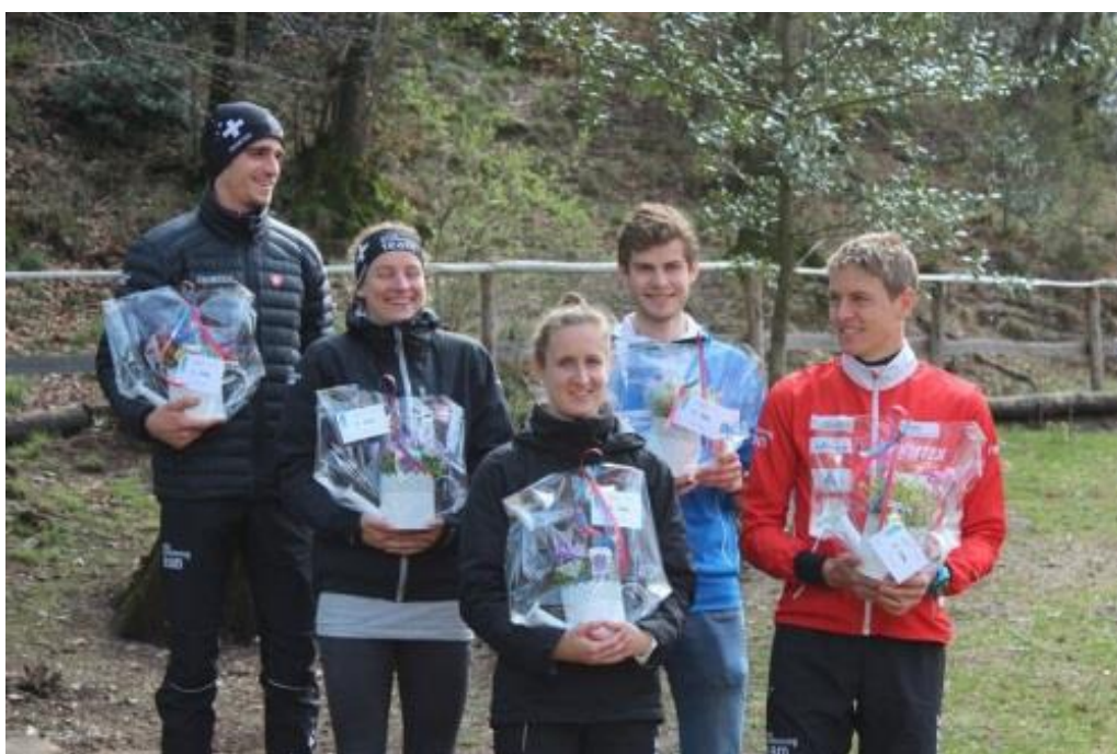
Premiati del TMO 2017 C.O. Aget Lugano a S. Zeno

Shop C.O.: sarà presente al centro gara il negozietto di C.O. "OL Plus/Ursli", con tutto il necessario per attrezzarvi per la nuova stagione orientistica.