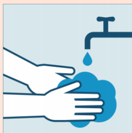
Laviamoci frequentemente le mani