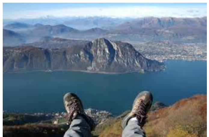
Vista da paura!!